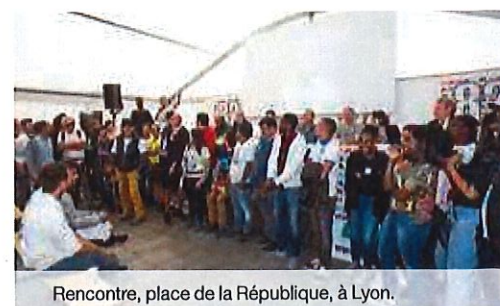
Rencontre, place de la République, à Lyon.