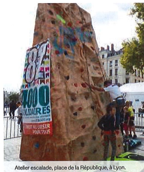
Atelier escalade, place de la République, à Lyon.