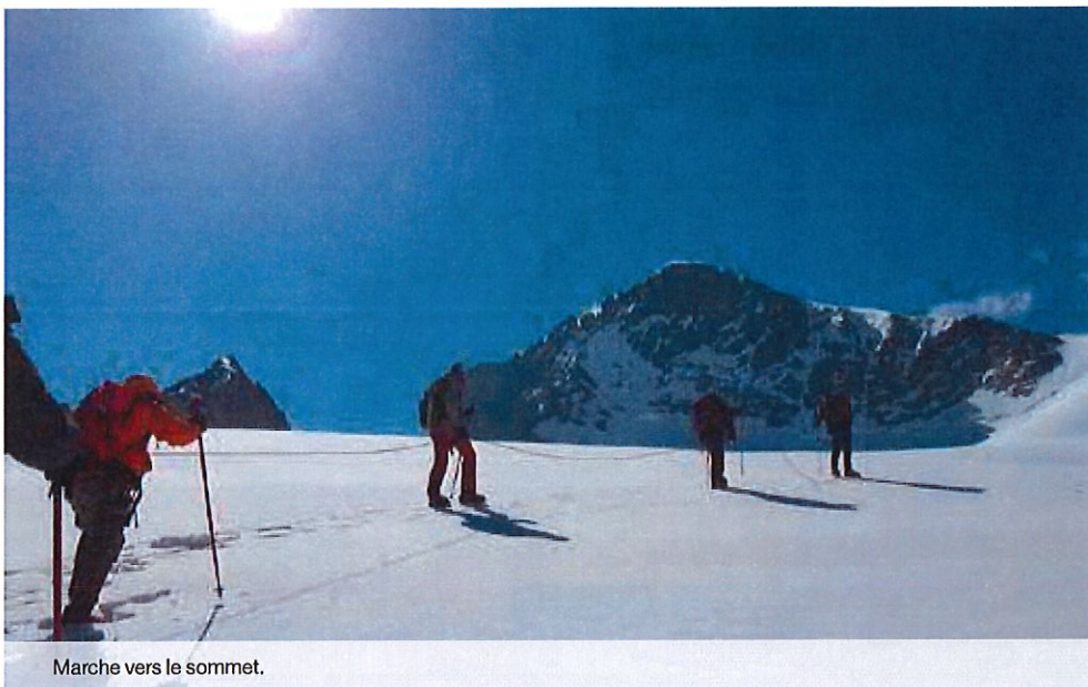
Marche vers le sommet.